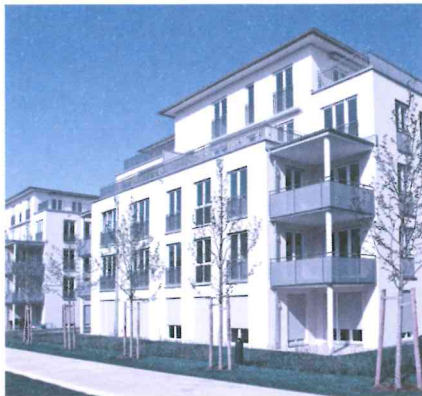
Steigt mit einer Umzonung die Ausnützungsziffer, entsteht ein Mehrwert.

terliegen seit dem 1. Mai 2019 einem Einzonungsstopp. Im Kanton Zürich rückt die Lösung näher: Es zeichnet sich ab, dass die Gemeinden für Auf- und Umzonungen eine Abgabe von bis zu 40 % auf den Mehrwert erheben dürfen, für Einzonungen von neuem Bauland soll die Abgabe 20 % des Mehrwerts betragen. Der Entscheid des Kantonsrats steht noch aus.