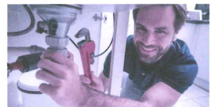
Nicht jeder, der selbstständig erwerbend scheint, ist es auch.

Beiträge fällig, ebenso Beiträge an die Familienausgleichskasse sowie der Beitrag an die Arbeitslosenversicherung.